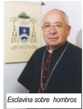
Esclavina sobre hombros

Los rectores de basílicas pueden llevarla de color negro con botones rojos, también otros prelados pueden usarla como signo de su autoridad en la comunidad.